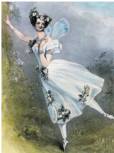
Так выглядела первая пачка, теперь она называется «шопенка». Мария Тильони в балете «Зефир и Флора».

Но с течением времени техника балерин усложнялась и потребовалась более легкая одежда для сцены. «Изобретателем» пачки считается французский художник и модельер Эжен Лами и впервые в такой юбке появилась балерина Мария Тальони в Париже в 1839 году. По одной из версий, толчком к созданию ставшей впоследствии классической балетной одежды стала нескладная фигура Марии. Чтобы скрыть недостатки, Филиппо Тальони придумал для дочери такое платье, которое придавало всему облику героини воздушность и грациозность.