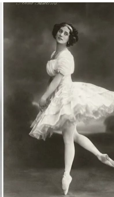
Анна Павлова в балетной пачке