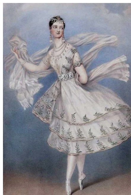
Кстати, Мария Тальони известна ещё и тем, что она первая из балерин в мире стала на пуанты.

восторга зрителей и искусствоведов, восхищавшихся воздушностью танцовщиц, не было предела. Не последнюю роль в этом сыграла пачка. Так этот костюм прижился, а потом стал классикой.